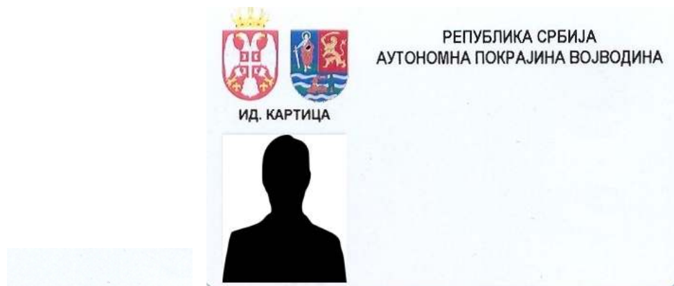
A tartományi köztisztviselők azonosító kártyájának alakja

6. A szerv foglalkoztatottjai azonosító jeleinek alakja, akik tevékenységüknél fogva kapcsolatba léphetnek a polgárokkal vagy a link ahhoz a helyhez, ahol azok láthatóak: