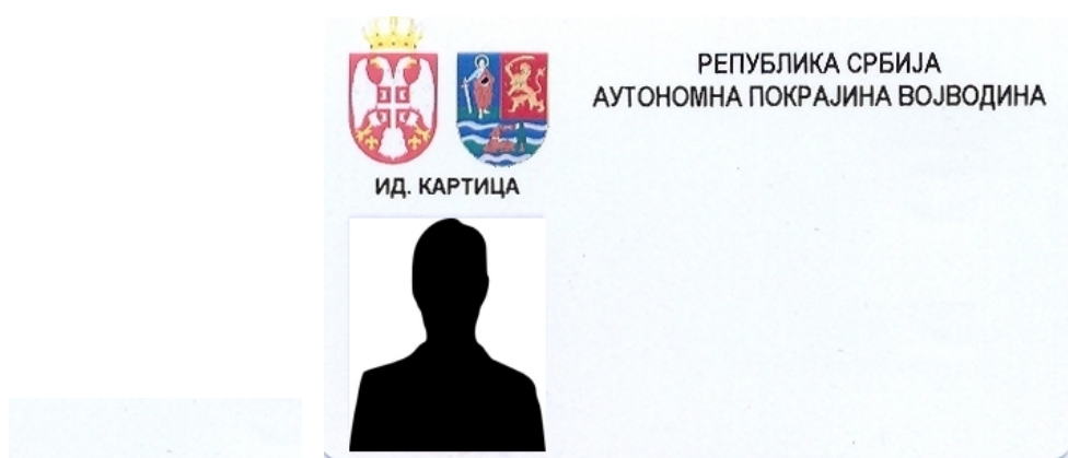
A tartományi köztisztviselők azonosító kártyájának alakja

6. A szerv foglalkoztatottjai azonosító jeleinek alakja, akik tevékenységüknél fogva kapcsolatba léphetnek a polgárokkal vagy a link ahhoz a helyhez, ahol azok láthatóak: