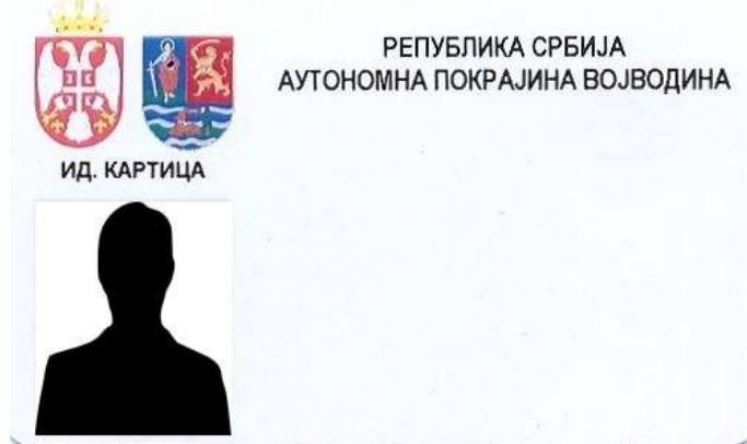
A tartományi köztisztviselők azonosító kártyájának alakja

6. A szerv foglalkoztatottjai azonosító jeleinek alakja, akik tevékenységüknél fogva kapcsolatba léphetnek a polgárokkal vagy a link ahhoz a helyhez, ahol azok láthatóak: