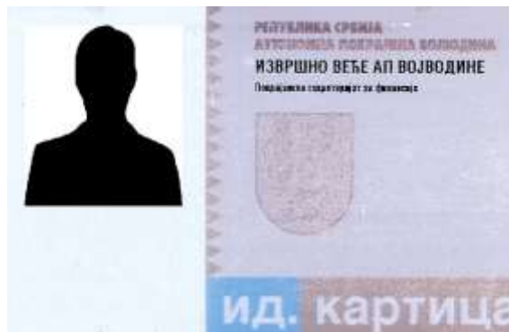
Izgled identifikacione kartice pokrajinskih slubenika