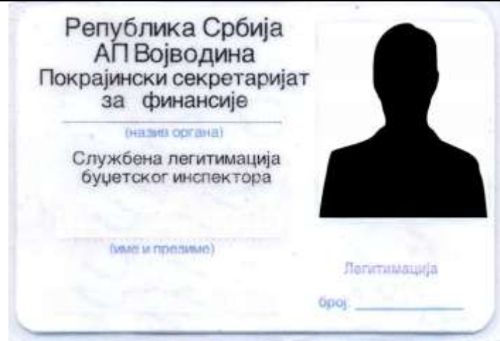
Izgled službene legimitacije budžetskog inspektora

Ažuriran zaključno sa 31. decembrom 2011. godine