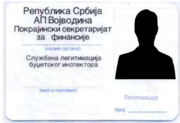
Izgled službene legimitacije proračunskog inspektora

7. Opis pristupačnosti prostorija za rad državnog tijela i njegovih organizacijskih jedinica osobama s invaliditetom: prostorije Pokrajinskog tajništva za finansije se nalaze u zgradi Vlade Autonomne Pokrajine Vojvodine (tzv. „Banovina“). U toj zgradi je osigurana pristupačnost prostorija za rad osobama s invaliditetom. Na stubištu ka ulazu postoji rampa, a na određenim stubištimu u samoj zgradi postavljena su posebna dizala. Pored toga, parking u ulici Banovinski prolaz (između zgrade Vlade i Skupštine AP Vojvodine) mogu koristiti za svoja vozila i invalidne osobe, za čije potrebe su posebno obilježena dva parking mjesta.