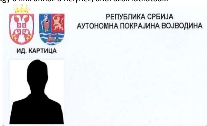
A tartományi köztisztviselők azonosító kártyájának alakja

6. A szerv foglalkoztatottjai azonosító jeleinek alakja, akik tevékenységüknél fogva kapcsolatba léphetnek a polgárokkal vagy a link ahhoz a helyhez, ahol azok láthatóak: