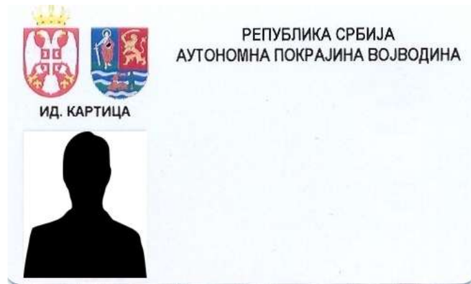
Izgled identifikacijske kartice pokrajinskih djelatnika