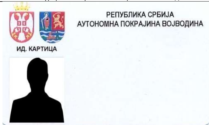
Изглед идентификационе картице покрајинских службеника

7. Опис приступачности просторија за рад државног органа и његових организационих јединица лицима са инвалидитетом: просторије Покрајинског секретаријата за финансије налазе се у згради Покрајинске владе (тзв. Бановина) у којој је обезбеђена приступачност просторија за рад лицима са инвалидитетом. На степеницама ка улазу постоји рампа, а на одређеним степеницама у самој згради постављени су посебни лифтови. Поред тога, паркинг у улици Бановински пролаз (између зграде Покрајинске владе и Скупштине АП Војводине), могу користити за своја возила и инвалидна лица, за чије потребе су посебно обележена два паркинг места.