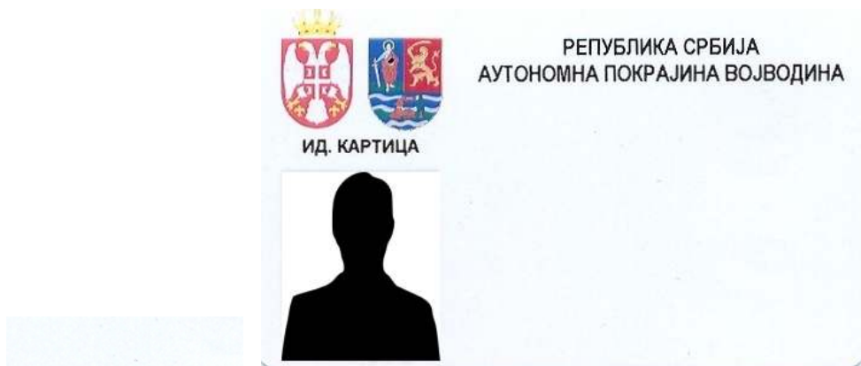
A tartományi köztisztviselők azonosító kártyájának alakja

6. A szerv foglalkoztatottjai azonosító jeleinek alakja, akik tevékenységüknél fogva kapcsolatba léphetnek a polgárokkal vagy a link ahhoz a helyhez, ahol azok láthatóak: