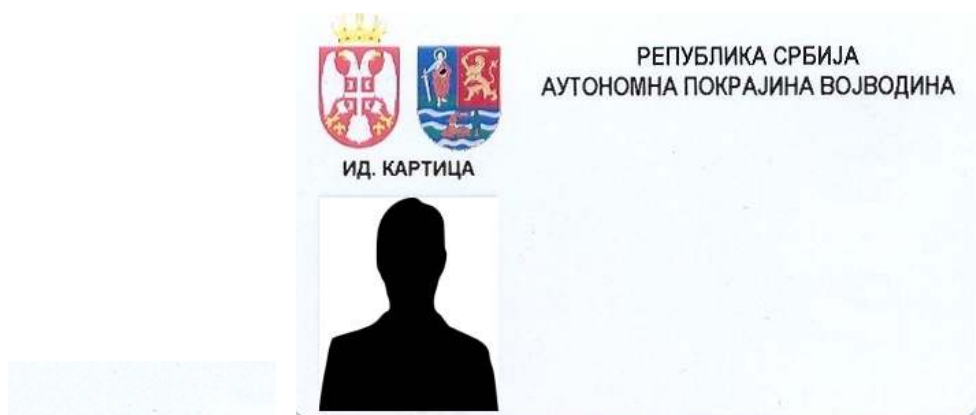
A tartományi köztisztviselők azonosító kártyájának alakja

6. A szerv foglalkoztatottjai azonosító jeleinek alakja, akik tevékenységüknél fogva kapcsolatba léphetnek a polgárokkal vagy a link ahhoz a helyhez, ahol azok láthatóak: