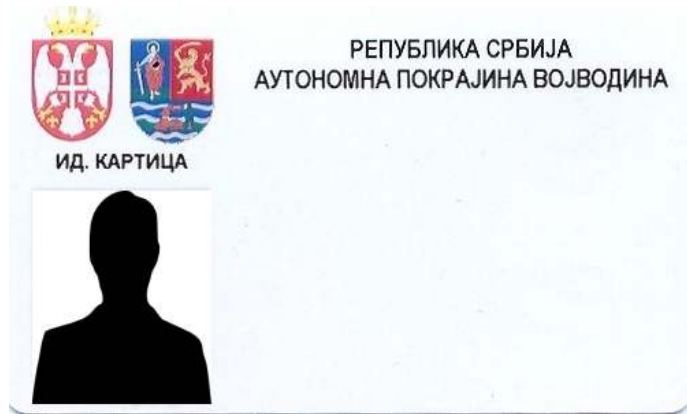
Изглед идентификационе картице покрајинских службеника

7. Опис приступачности просторија за рад државног органа и његових организационих јединица лицима са инвалидитетом: просторије Покрајинског секретаријата за финансије налазе се у згради Покрајинске владе (тзв. Бановина) у којој је обезбеђена приступачност просторија за рад лицима са инвалидитетом. На степеницама ка улазу постоји рампа, а на одређеним степеницама у самој згради постављени су посебни лифтови. Поред тога, паркинг у улици Бановински пролаз (између зграде Покрајинске владе и Скупштине АП Војводине), могу користити за своја возила и инвалидна лица, за чије потребе су посебно обележена два паркинг места.