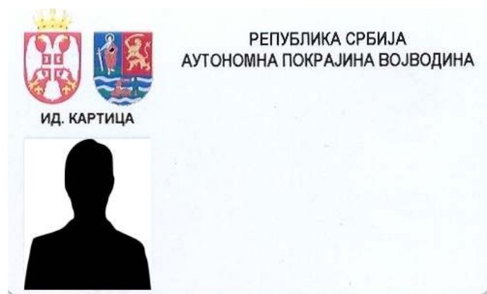
Aspectul buletinului de identificare al funcționarilor provinciali