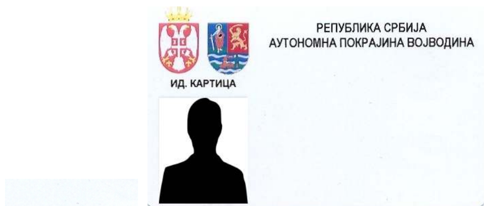
Izgled identifikacione kartice pokrajinskih službenika

6. Izgled identifikacionih obeležja zaposlenih u organu koji mogu doći u dodir s građanima po prirodi svog posla ili link ka mestu gde se ona mogu videti: