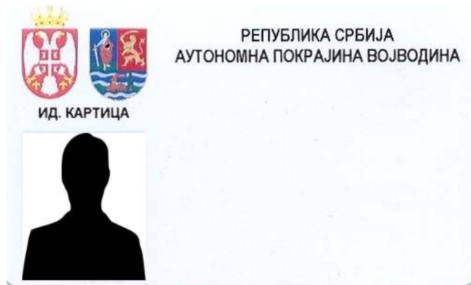
A tartományi köztisztviselők azonosító kártyájának alakja

6. A szerv foglalkoztatottjai azonosító jeleinek alakja, akik tevékenységüknél fogva kapcsolatba léphetnek a polgárokkal vagy a link ahhoz a helyhez, ahol azok láthatóak: