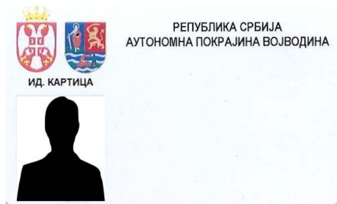
Aspectul buletinului de identificare al funcționarilor provinciali