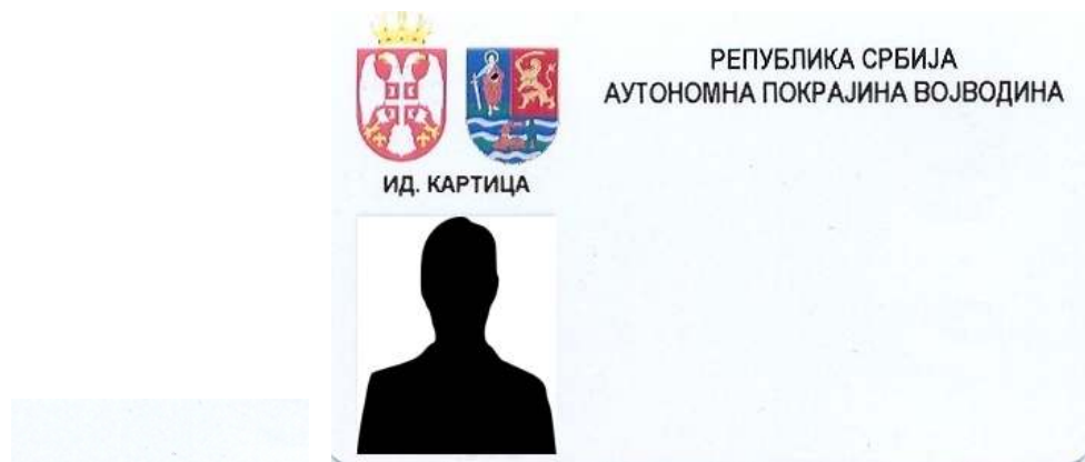
A tartományi köztisztviselők azonosító kártyájának alakja

6. A szerv foglalkoztatottjai azonosító jeleinek alakja, akik tevékenységüknel fogva kapcsolatba léphetnek a polgárokkal vagy a link ahhoz a helyhez, ahol azok láthatóak: