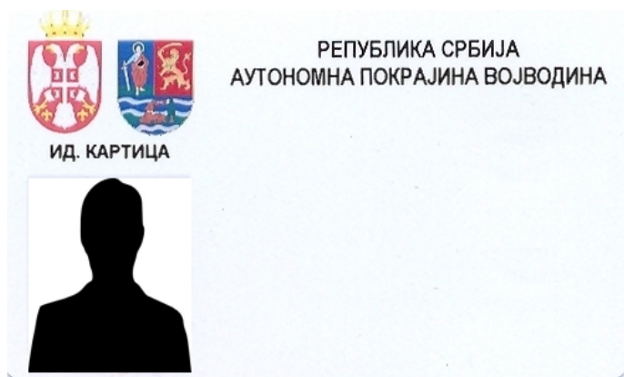
A tartományi köztisztviselők azonosító kártyájának alakja

6. A szerv foglalkoztatottjai azonosító jeleinek alakja, akik tevékenységüknél fogva kapcsolatba léphetnek a polgárokkal vagy a link ahhoz a helyhez, ahol azok láthatóak: