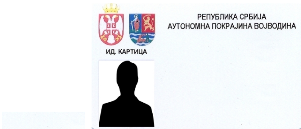
Изглед идентификационе картице покрајинских службеника

6. Изглед идентификационих обележја запослених у органу који могу доћи у додир с грађанима по природи свог посла или линк ка месту где се она могу видети: