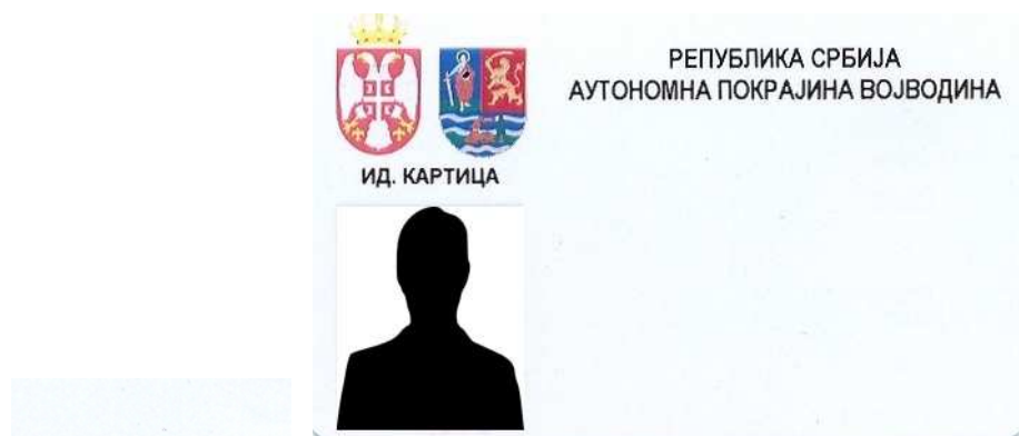
A tartományi köztisztviselők azonosító kártyájának alakja

6. A szerv foglalkoztatottjai azonosító jeleinek alakja, akik tevékenységüknél fogva kapcsolatba léphetnek a polgárokkal vagy a link ahhoz a helyhez, ahol azok láthatóak: