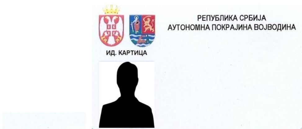
Izgled identifikacione kartice pokrajinskih službenika

6. Izgled identifikacionih obeležja zaposlenih u organu koji mogu doći u dodir s građanima po prirodi svog posla ili link ka mestu gde se ona mogu videti: