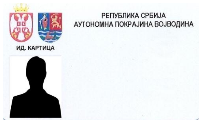
Aspectul buletinului de identificare al funcționarilor provinciali

6. Aspectul însemnelor de identificare al angajaților în organ care pot ajunge în contact cu cetățenii după natura activității lor sau link spre locul unde unde acestea se pot vedea: