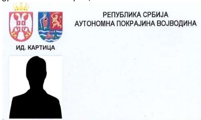
A tartományi köztisztviselők azonosító kártyájának alakja

6. A szerv foglalkoztatottjai azonosító jeleinek alakja, akik tevékenységüknél fogva kapcsolatba léphetnek a polgárokkal vagy a link ahhoz a helyhez, ahol azok láthatóak: