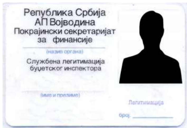
Izgled službene legitimacije proračunskog inspektora

7. Opis pristupačnosti prostorija za rad državnog tijela i njegovih organizacijskih jedinica osobama s invaliditetom: prostorije Pokrajinskog tajništva za finansije se nalaze u zgradi Pokrajinske vlade (tzv. „Banovina“). U toj zgradi je osigurana pristupačnost prostorija za rad osobama s invaliditetom. Na stubištu ka ulazu postoji rampa, a na određenim stubištima u samoj zgradi postavljena su posebna dizala. Pored toga, parking u ulici Banovinski prolaz (između zgrade Pokrajinske vlade i Skupštine AP Vojvodine) mogu koristiti za svoja vozila i invalidne osobe, za čije potrebe su posebno obilježena dva parking mjesta.