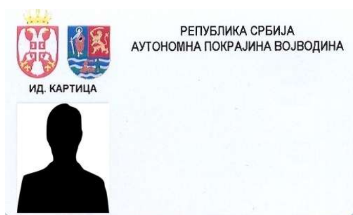
Výzor identifikačnej karty pokrajinských úradníkov

6. Výzor identifikačných kariet zamestnancov v orgáne, ktorí môžu prísť k styku s občanmi podľa povahy svojej práce alebo odkaz na miestu, kde sa môžu vidieť: