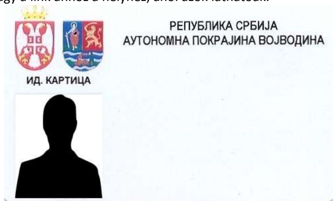
A tartományi köztisztviselők azonosító kártyájának alakja

6. A szerv foglalkoztatottjai azonosító jeleinek alakja, akik tevékenységüknél fogva kapcsolatba léphetnek a polgárokkal vagy a link ahhoz a helyhez, ahol azok láthatóak: