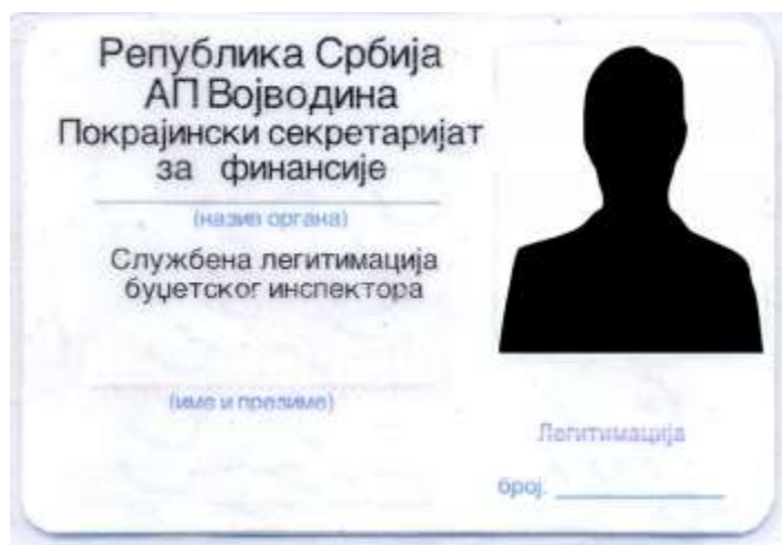
A költségvetési felügyelő szolgálati igazolványának alakja

7. Az állami szerv és szervezeti egységei munkájára szolgáló helyiségek a mozgáskorlátozott személyek számára való hozzáférhetőségének leírása: a Tartományi Pénzügyi Titkárság helyiségei a Tartományi Kormány épületében vannak (ún. Báni palota). Ebben az épületben a mozgáskorlátozottak számára lehetővé tették a helyiségekbe jutást. A bejárati lépcsőkön van rámpa, egyes lépcsőkön pedig külön felvonók találhatóak. Ezenkívül, a Báni átjáróban levő parkolóhelyen (a Tartományi Kormány és a Vajdaság AT Képviselőházának épületei között) a mozgáskorlátozottak is használhatják járművüket, amelyhez két parkolóhely van kijelölve.